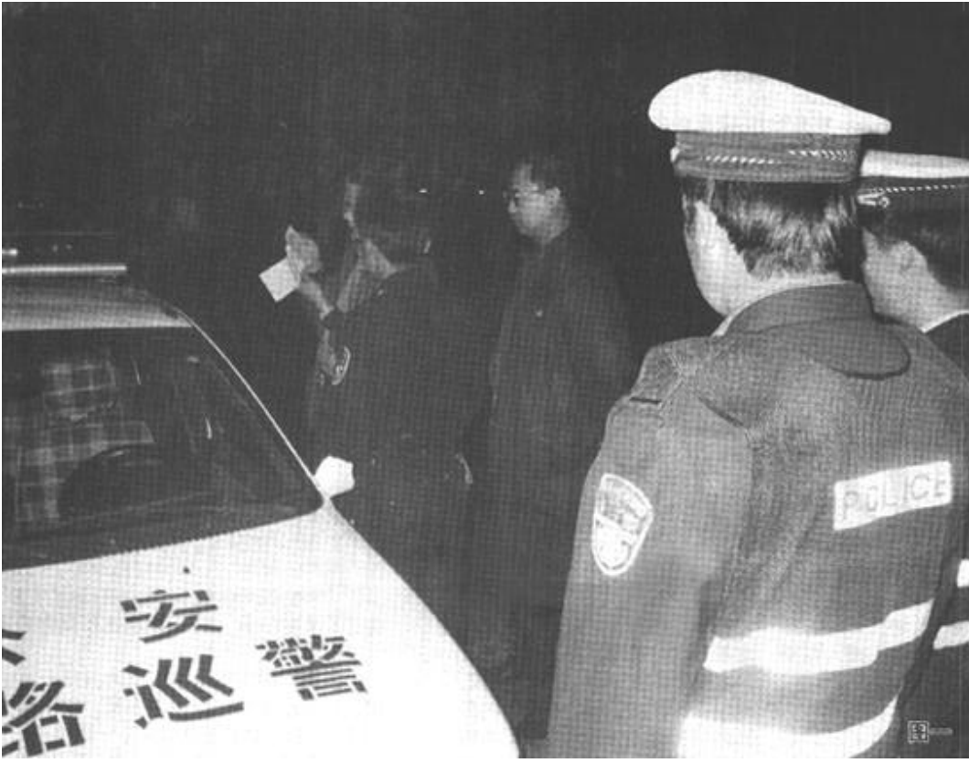
图一: 纠风人员正在对执法干警的手续进行检查 图二: 检查人员认真查看被查司机的罚款单据

进入10月份以来,我市公路“三乱”治理检查组加大整治力度,利用白天及夜间时间,多次组织纠风检查机动,取得了显著成效,受到了广大司机朋友的一致好评。(方正)