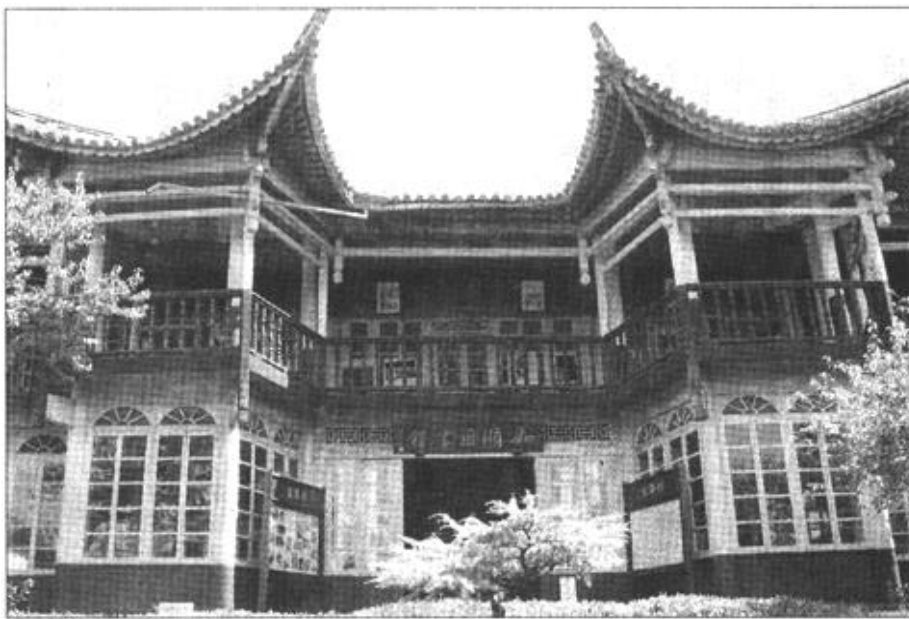
这是9月3日拍摄的和顺图书馆。该图书馆位于中缅边境地区华侨聚居的云南省腾冲县和顺乡,是旅滇华侨为振兴家乡文化于1928年集资建造。和顺图书馆为中西合璧式建筑,1993年被列为云南省重点文物保护单位。目前图书馆藏书7万多册,并有清代木刻珍本、早期《东南亚》、《华侨史》等珍本,订有各种报刊、杂志70多种,是全乡各族侨胞学习文化知识的“基地”。

新华社北京10月18日电 《江泽民论有中国特色社会主义》(专题摘编)和江泽民《论科学技术》、《论“三个代表”》、《论党的建设》这四部论著的电子版图书,近日由中央文献音像出版社出版。