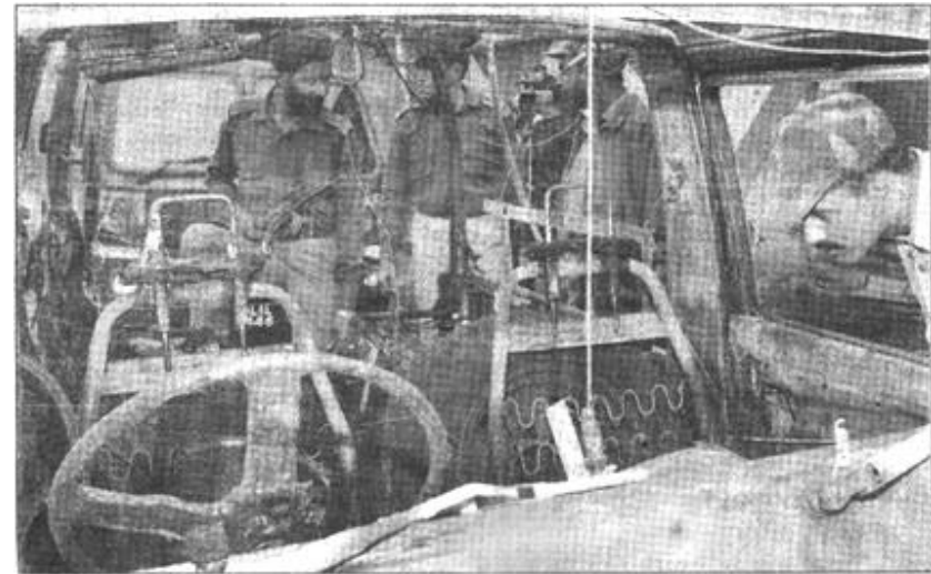
10月19日,印度边境安全部队士兵在印控克什米尔地区检查被炸的车辆。据印度准军事部队发言人称,当天发生的这起爆炸事件造成1名警察死亡,15人受伤。

参与鉴定的专家一致认为,这一教育资源库内容丰富、实用、规范,达到国内先进水平;资源管理系统符合国家基础教育资源建设的技术标准要求;资源应用系统在设计思想、技术实现和体系建设方面处于国内领先水平。